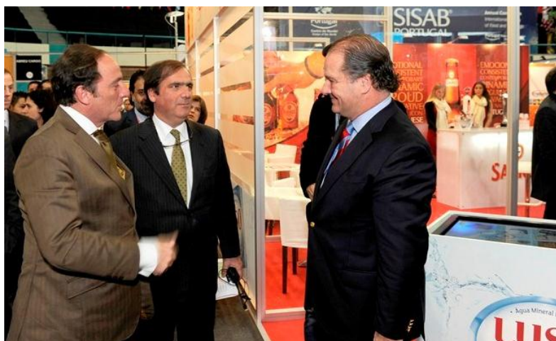
Paulo Portas, Ministro de Estado e dos Negócios Estrangeiros visita o Stand da SCC