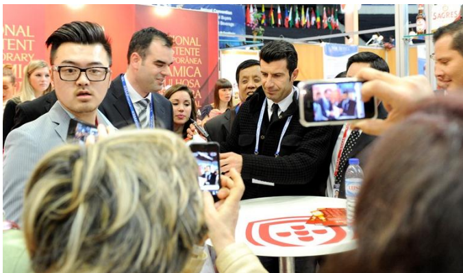
Luís Figo, embaixador da Cerveja Sagres dando autógrafos aos visitantes