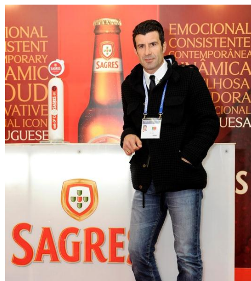
Luís Figo, embaixador da Cerveja Sagres no Stand da SCC

Decorre de 25 a 27 de Fevereiro, no Pavilhão Atlântico (Parque das Nações, Lisboa - Portugal), o SISAB 2013 – Salão Internacional do Setor Alimentar e Bebidas já na sua 18ª Edição. É durante este evento que se promovem os encontros das maiores Empresas Portuguesas exportadoras com os Importadores de todo o Mundo.