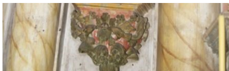
ANTES DO RESTAURO