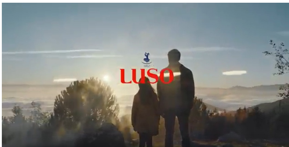
Nova Campanha da Água de Luso

A Serra do Bussaco, origem da Água de Luso, foi o local escolhido para apresentar e filmar a nova Campanha, uma homenagem a um dos pilares fundamentais da identidade da marca: uma origem única, caracterizada por uma riqueza natural, que resulta nesta água mineral natural centenária.